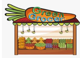
the green grocer's