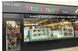
the stationery shop